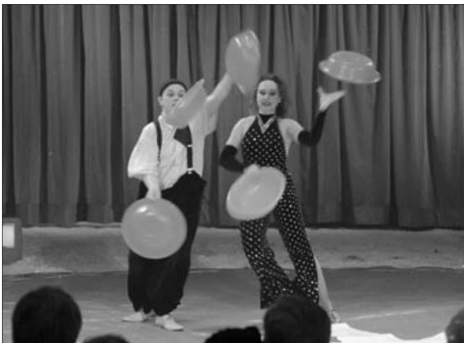
Duet Blues tillhör en av nyskapande komediakterna vi sett på Cirkus Maximum de senaste åren.