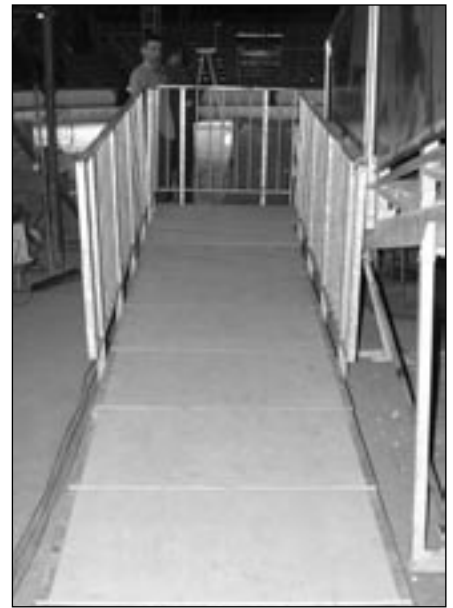
Handikappramp för rullstolar.

föreställningen. När Skratt besöker städer där de ligger en längre tid, som Göteborg och Stockholm, bygger de ut gradängen ända till manegekanterna. Då får även loge-