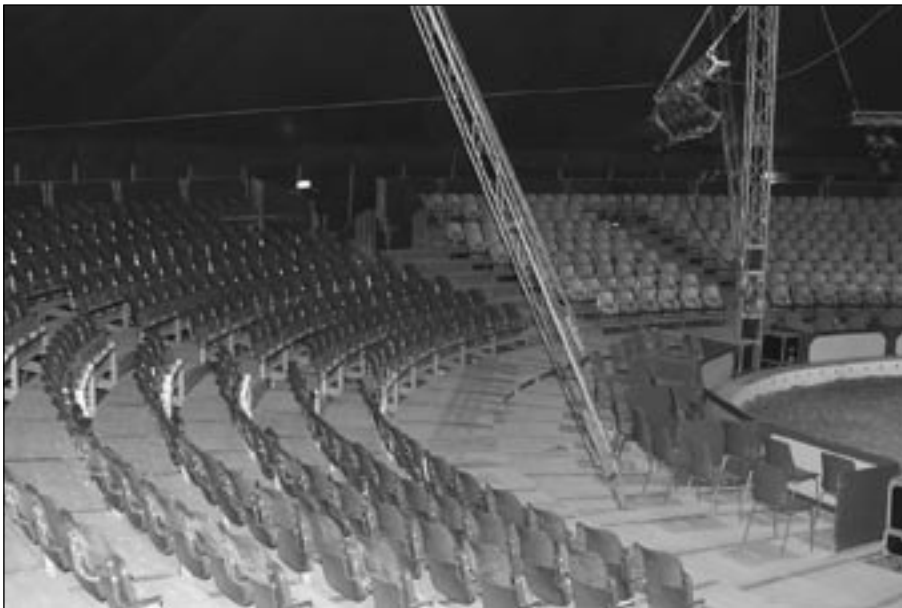
Cirkus Skratts nya gradäng i Göteborg.

Till premiären i Grästorp i april fick Cirkus Skratt en ny gradäng tillverkad av Calcide i Italien. Alla 1175 st besökarna sitter på bekväma plaststolar och njuter av