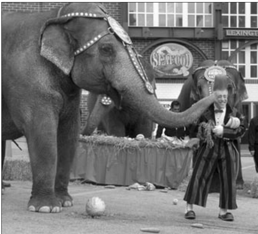
Bello Nock med Ringling elefanter.

Bello saknades. Plötsligt såg man honom på en videoskärm som han hade uppenbara svårigheter att ta sig igenom. Föreställningen fortsatte utan Bello medan människor och djur av olika slag visade sig på arenan. Plötsligt hördes en explosion varvid videoskärmen gick sönder. Bello flög upp i luften och hamnade i en trapets under det att tio elefanter – fem på var sida – gick snabel-svans runt arenan. De efterträddes av Palazovitruppen – elva språngbrädesakrobater – som gjorde en rad uppseendeväckande trick med en fem man hög kolonn som topprestation. De omgavs av Zunyi-truppen i Rhönråd och ringar. Bello hoppade in som deltagare och sjöng "You are Beautiful" medan en kvinnlig artist gjorde luftakrobatik i asiatisk ring. Hur Bello skulle visa sin kärlek var ett tema som sedan återkom i showen då han förgäves försökte överlämna en hjärtformad ballong till en flicka eller uppvakta en annan artist utan framgång.