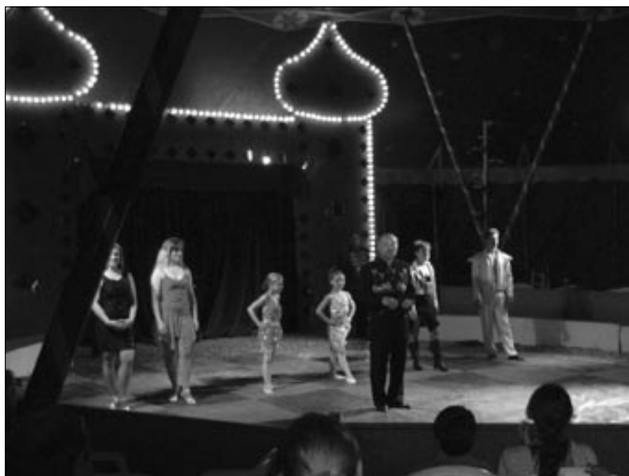
Cirkus Madigan är åter ute på turné efter att arbetat med skolor i några år.