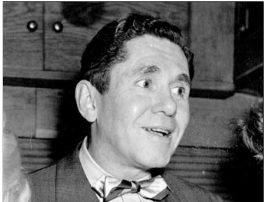
John Ringling North 1955 i Stockholm.

I början av augusti 1956 kom pressen världen över med nyheten om att Ringling avbrutit sin turné och återvänt till vinterkvarteret. Vid denna var det beläget i Sarasota, Florida. I en pressrelease med-