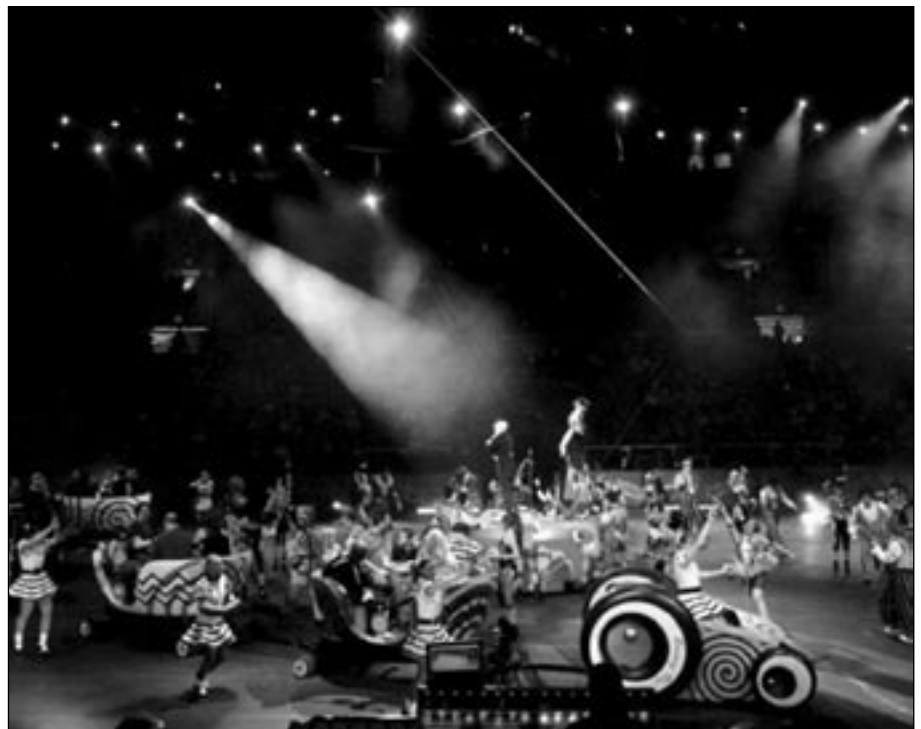
Parad hos Ringlings.

arenan för den stora finalen där slutligen Henantruppen – 19 kineser – visade sina färdigheter i tolv hängande stänger.