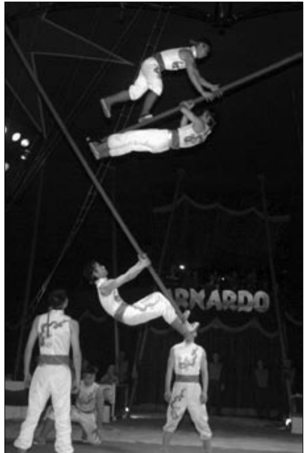
Zhengzhou Acrobatic Troupe med Swaying Pole hos Cirkus Arnardo i Norge.